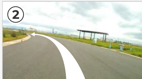
第1コーナー。ペースが速い時は自転車が大きく左に倒れ込みます。ペダルが地面と接触しないよう注意！