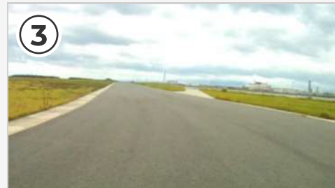
第1コーナーを立ち上がると200mの直線。