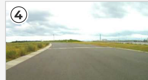
スタート地点から300m。緩やかな左コーナー。コーナーは緩いのでペダルを漕ぎながらでもOK。次のコーナーは左へ鋭角に曲がるので走行ラインを徐々に右側へ。