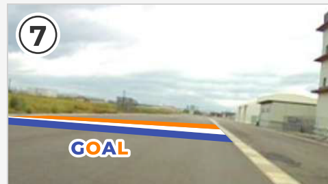
ゴール地点。 ゴール後コースは緩やかに左へ曲がっています。気を抜かずしっかりと前を見て走りましょう。