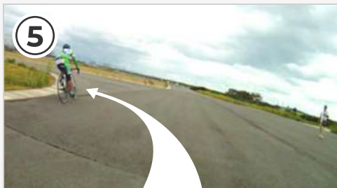
左鋭角コーナー。コーナー手前で減速を終えてから自転車を倒し込みましょう。