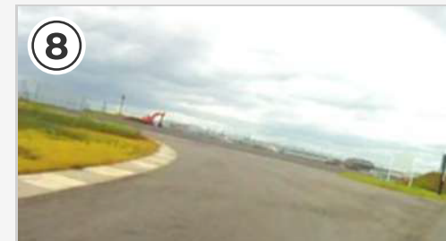
左高速コーナー。ペダルと地面の接触到注意。